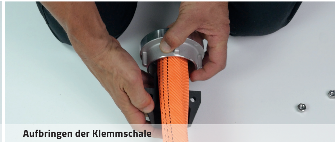
Aufbringen der Klemmschale