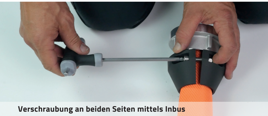
Verschraubung an beiden Seiten mittels Inbus