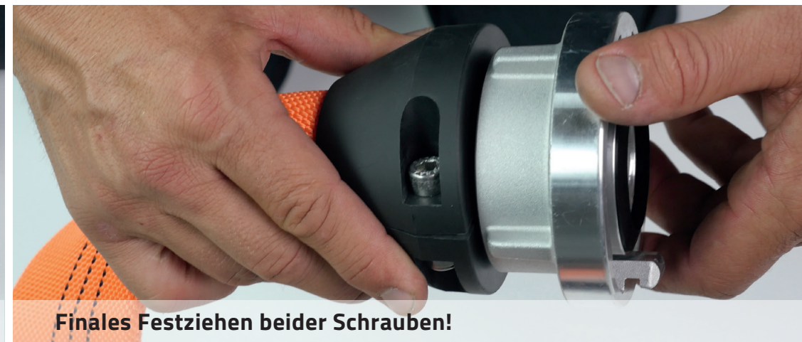
Finales Festziehen beider Schrauben!

Die visionäre Lösung für den Einband der Zukunft